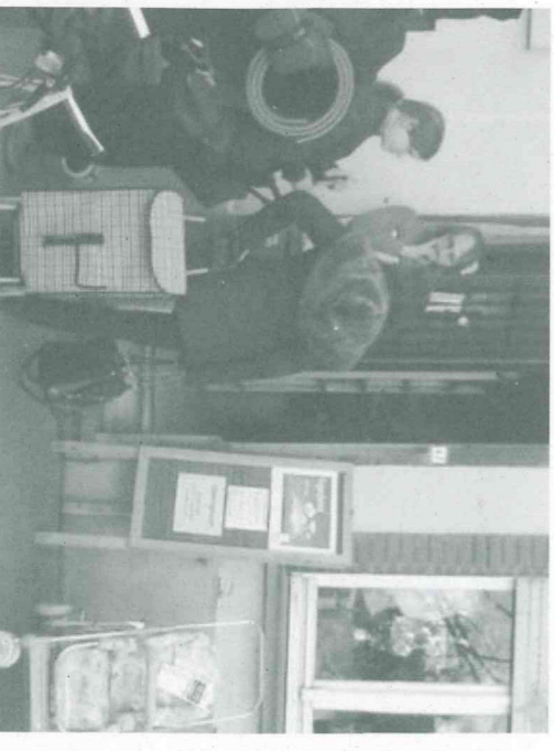
Het huisje van overvloed: iedereen, arm en rijk, is welkom voor een bezoekje in deze winkel.